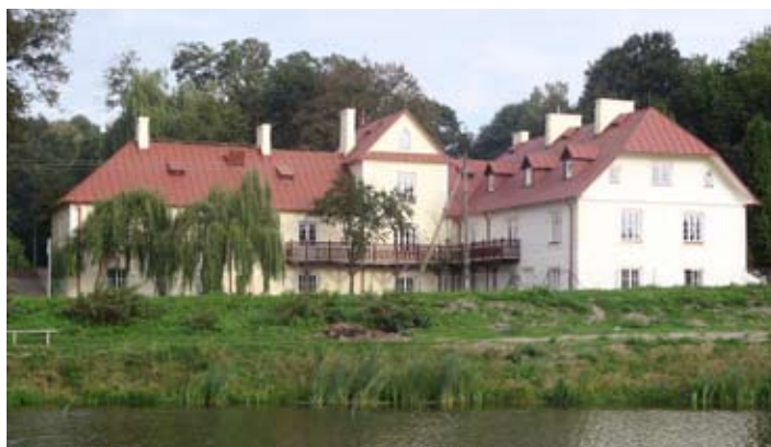
W odnowionym dworku będzie się skupiać życie kulturalne mieszkańców gminy.

Projekt współfinansowany ze środków Europejskiego Funduszu Rozwoju Regionalnego w ramach Regionalnego Programu Operacyjnego Województwa Lubelskiego na lata 2007 – 2013.