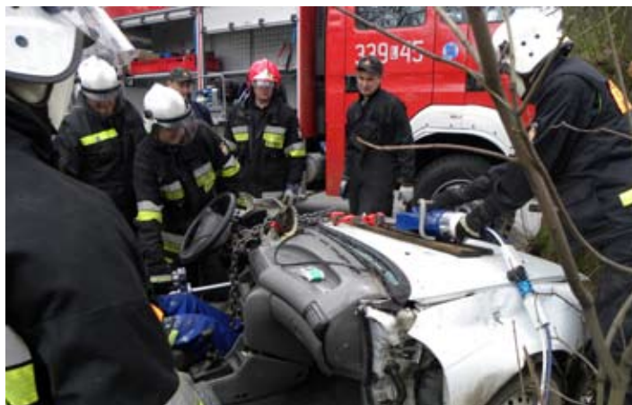
Strażacy ochotnicy podczas ćwiczeń.