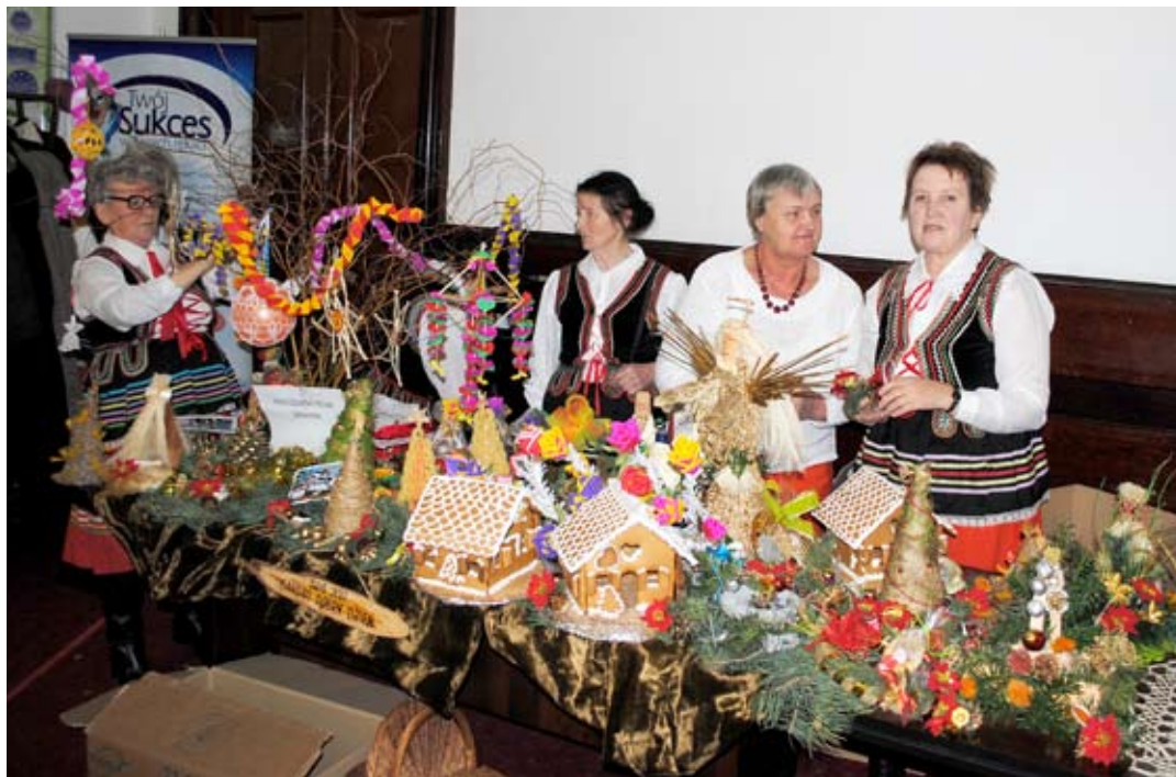
Pajęczki, łańcuchy, stroiki i piernikowe chatki wprowadzają w bożonarodzeniowy nastrój.

Ubiegłoroczne spotkanie dotyczyło lokalnych i tradycyjnych produktów kulinarnych w ujęciu przepisów prawa krajowego i wspólnotowego, dobrych praktyk związanych z wykorzysta-