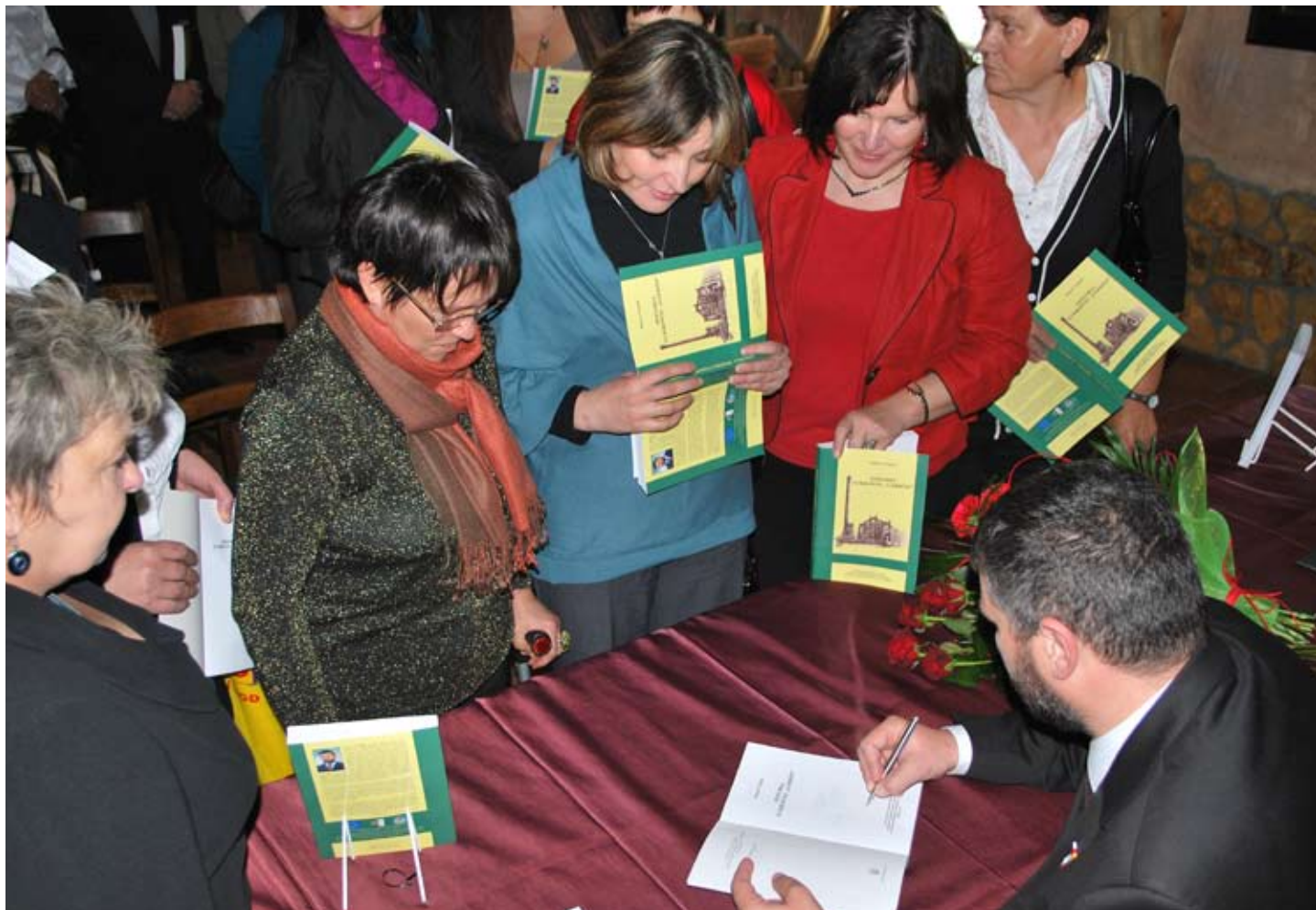
Każdy chciał mieć książkę z autografem autora.