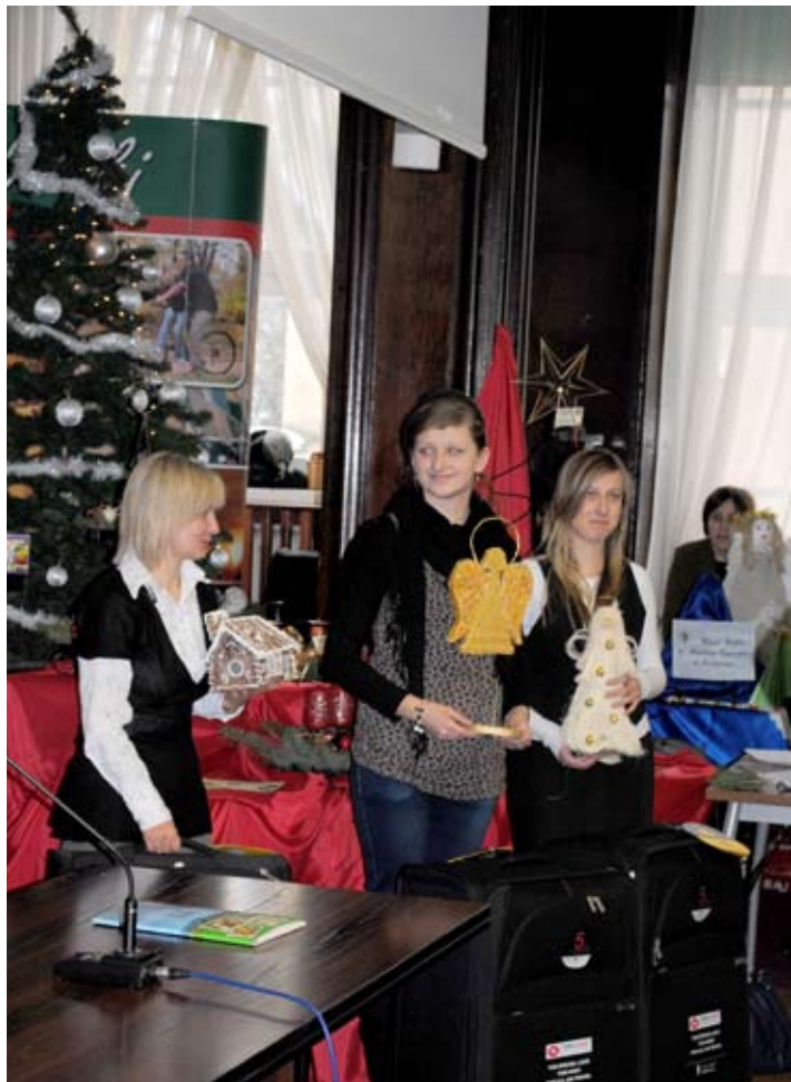
Uczniowie nagrodzeni w konkursie na najładniejszy stroik.