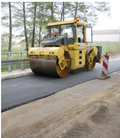
Remont mostów na drodze Bełżyce – Strzeszkowice w powiecie lubelskim.