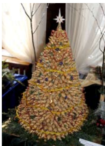
Choinka z setek błyszczących szyszek może być ozdobą świątecznego stołu.