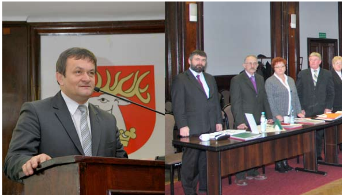
Paweł Pikula rozpoczyna kolejną kadencję na stanowisku starosty lubelskiego.