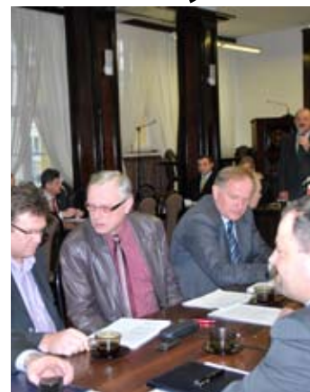
Jak pomóc szpitalom? – zastanawiali się uczestnicy obrad.