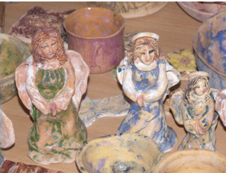
Własnoręcznie wykonana praca to ogromna satysfakcja.