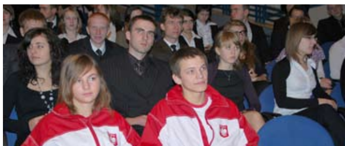
Zdolni i wysportowani – młodzi stypendyści 2010/2011 roku.

Stypendium premiera jest przyznawane uczniowi, który otrzymał promocję z wyróżnieniem, uzysku-