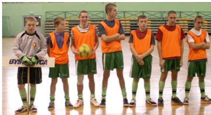
Wicemistrzowie z SOSW Bystrzycy.