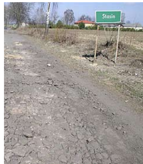
W przyszłym roku z trasy Miłocin – Stasin – Podole znikną przełomy.