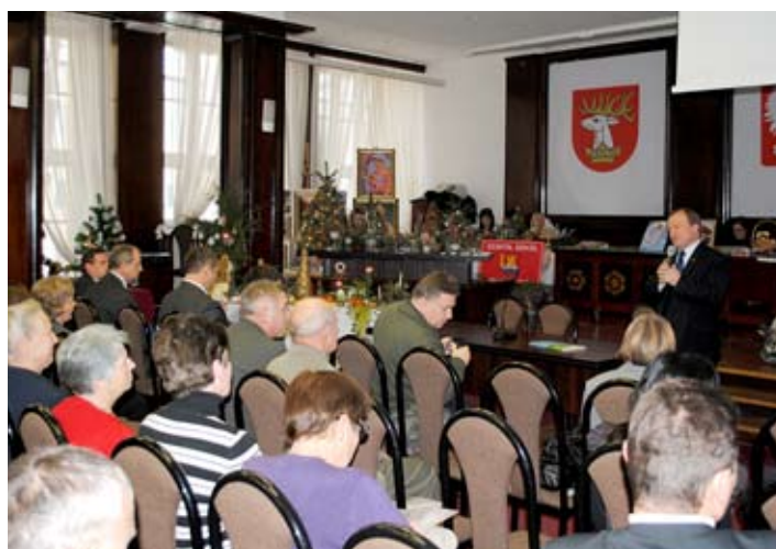
Świąteczne życzenia złożył wszystkim poseł Jan Łopata.