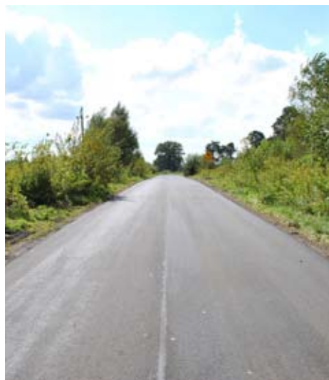
Droga Zalesie – Brzeziczki w powiecie świdnickim po przebudowie.