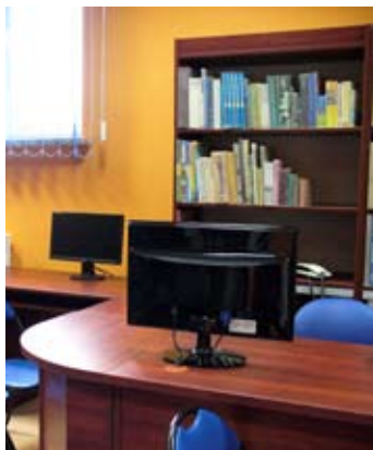
Nowoczesna filia biblioteki w Starej Wsi.

Wszystkie kompleksy, zarówno place zabaw, jak i obiekty sportowe są ogólnodostępne. Są