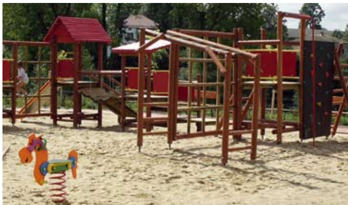
Plac zabaw w Krzczonowie.

Nowe place zabaw mają też do dyspozycji dzieci w Krzczonowie oraz w miejscowościach