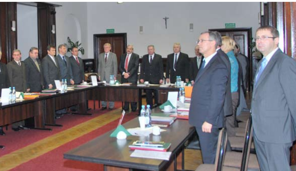
Na pierwszej sesji radni złożyli ślubowanie i wybrali władze rady i powiatu.