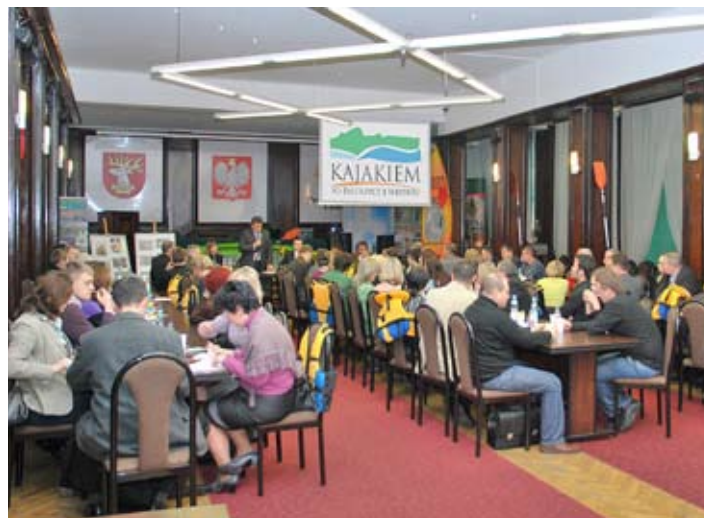
Goście na premierze filmu dopisali.

Projekt współfinansowany ze środków Europejskiego Funduszu Rozwoju Regionalnego w ramach Regionalnego Programu Operacyjnego Województwa Lubelskiego na lata 2007-2013