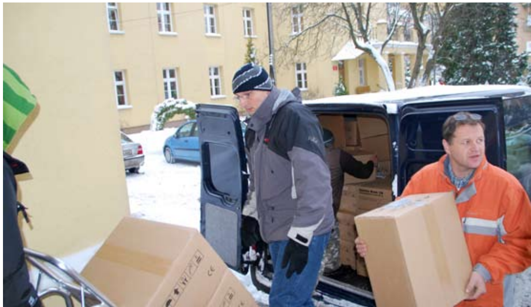
Do wszystkich urzędów trafi wysokiej klasy sprzęt komputerowy (firma Asseco BS odpowiedzialna za dostawy sprzętu i oprogramowania).

Jej wartość to 6,5 mln zł. Inwestycja jest współfinansowana za środków unijnych w ramach Regionalnego Programu Operacyjnego Województwa Lubelskiego na lata 2007 – 2013. Oś Priorytetowa IV Społeczeństwo Informacyjne, Działanie 4.1 Społeczeństwo informacyjne.