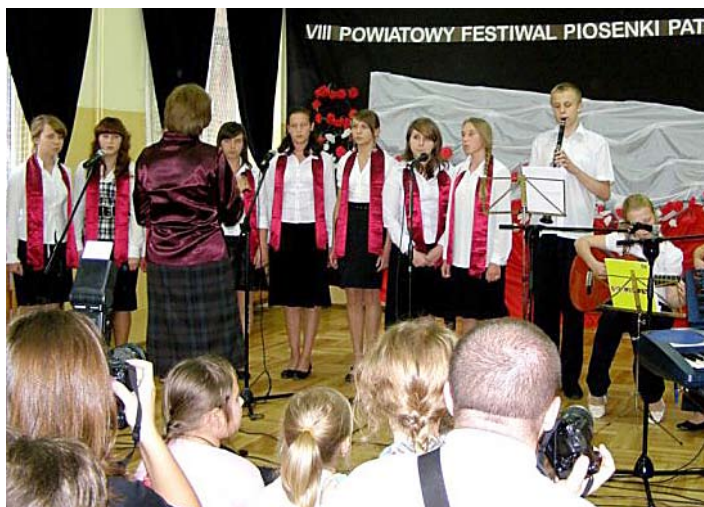
Grand Prix festiwalu wyspiewał Zespół Gimnazjum z Niedzwicy Dużej.

VIII Powiatowy Festiwal Piosenki Patriotycznej, zorganizowany przez Zespół Szkół