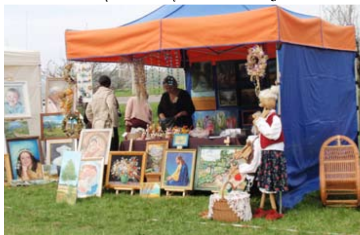
Stoisko stowarzyszenia na Święcie Jesieni w Kazimierzu Dolnym.