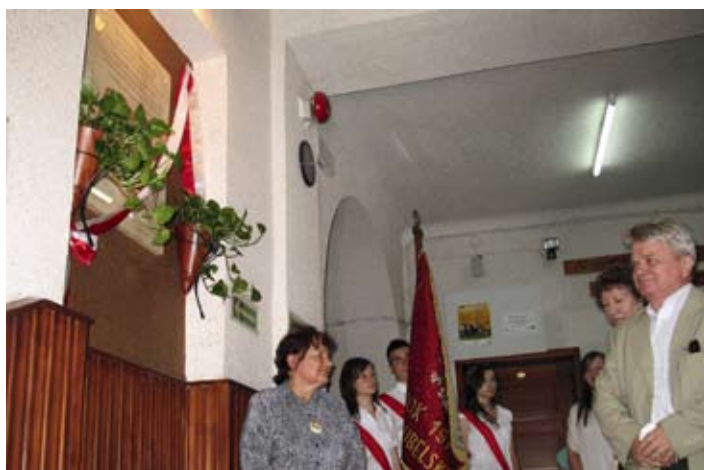
Pamiątkowa tablica zawisła w głównym holu Zespołu Szkół w Bychawie.