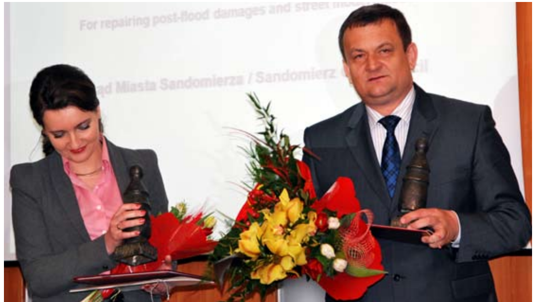
Starosta lubelski jest jednym z pięciu laureatów nagrody „Polskie Drogi XXI” (obok przedstawicielka marszałka Sejmu).

Do końca tego roku powstanie w sumie m.in. 155 kilometrów dróg, 48 kilometrów