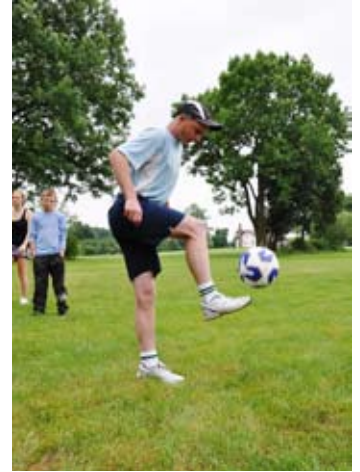
Żonglerka piłką wymaga dużo uwagi i zręczności.

Po skończonej zabawie wspólnie biesiadowaliśmy. Nie zabra-