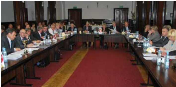
Rada Powiatu pozytywnie oceniła działania zarządu poprzedniej kadencji i udzieliła absolutorium.