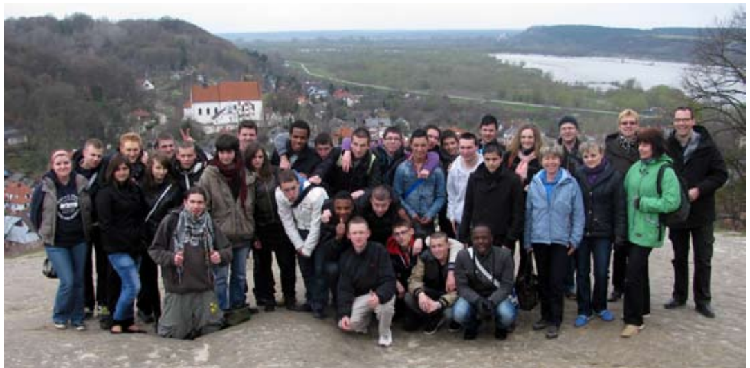
Goście podziwiali Kazimierz Dolny z Góry Trzech Krzyży.

Uczniowie z Francji odwiedzili w kwietniu Zespół Szkół Zawodowych nr 1 im. mjr. H. Dobrzańskiego w Bychawie. Była to grupa młodzieży z zaprzyjaźnionej szkoły Lycée Monge La Chauvinière z Nantes, która przyjechała z rewizytą. Kilka lat temu uczniowie bychawskiej placówki z technikum mechanicznego byli na praktyce zawodowej w Nantes, zorganizowanej w ramach programu „Leonardo da Vinci”. Podtrzymywane przez ten czas kontakty między uczniami obu szkół zaowocowały przyjazdem Francuzów do Bychawy.