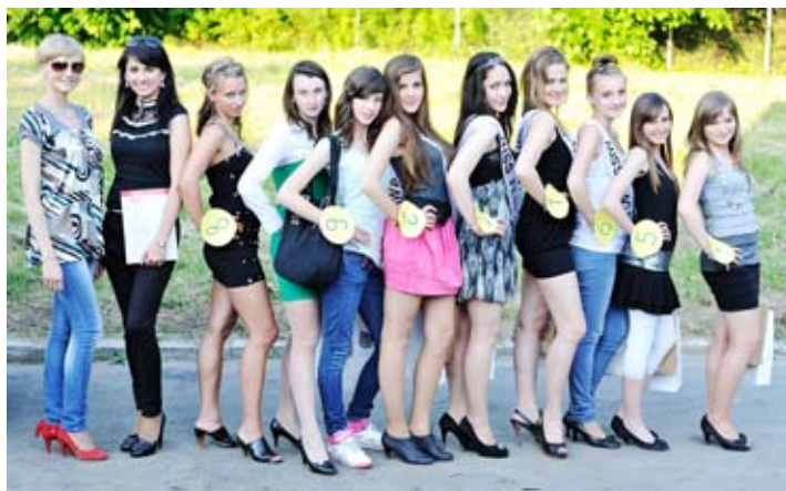
Piękne i odważne uczestniczki konkursu Miss Festynu (od lewej organizatorki wyborów).