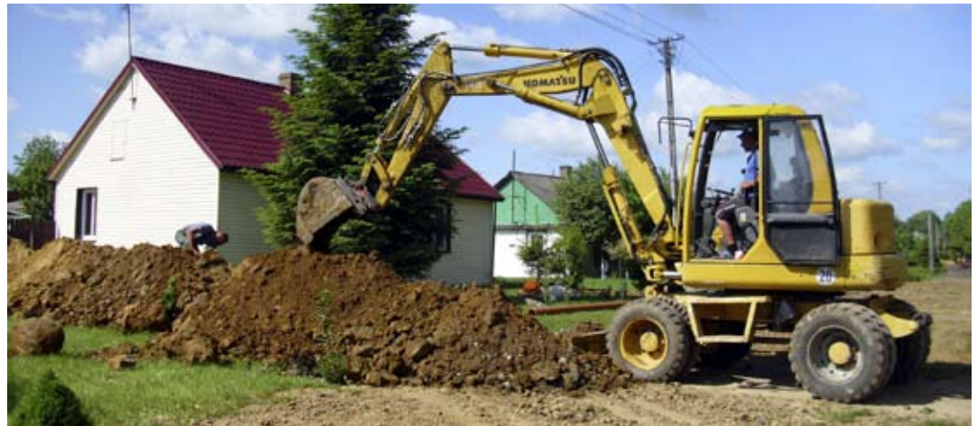
Do nowej sieci przyłączy się około pół tysiąca odbiorców.

W sumie ma powstać około 60 km sieci wodociągowej i kanalizacyjnej. Roboty obejmą ulice: