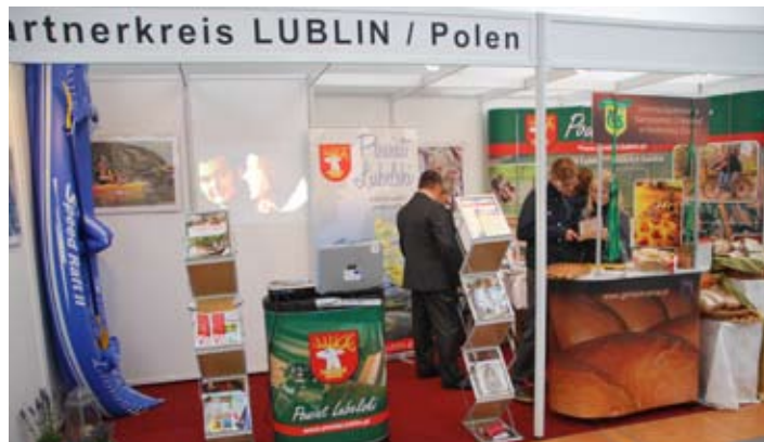
Tym razem na targach w Wächtersbach Powiat Lubelski postawił na turystykę i promocję lokalnych produktów.

Do korzystania z rozwijającej się w szybkim tempie turystyki kajakowej zachęcał stający na stoisku kajak oraz film promujący spływy kajakowe po Wieprzu i Bystrzycy. Z kolei propozycje dla miłośników wędrówek pieszych i rowerowych w połączeniu z agroturystyczną bazą noclegową okazały się doskonałą ofertą promującą turystykę wiejską. Zachęcaliśmy również do uprawiania turystyki konnej, która od kilkunastu lat przeżywa renesans i staje się nie tylko sposobem na aktywny