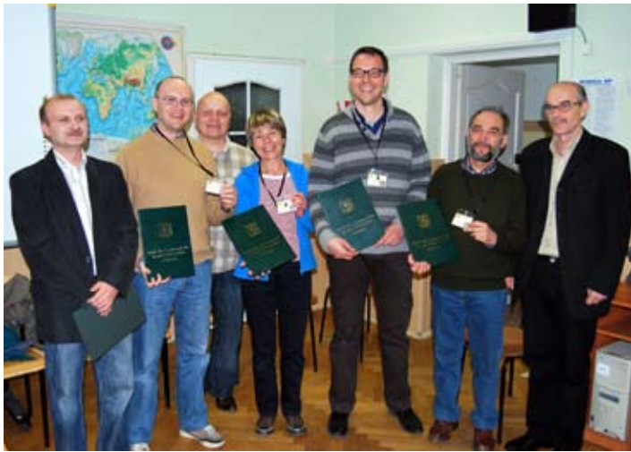
Po ślubowaniu i pasowaniu – nauczyciele z Francji weszli do kadry bychawskiej placówki.