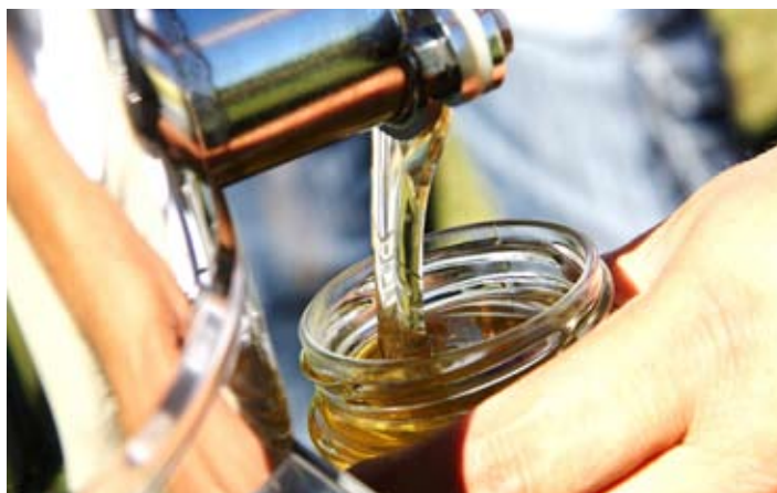
Miód świeżo odwirowany w miodarce.

Słodkimi atrakcjami towarzyszyła muzyka. Na scenie w centrum pszczelowskiego stadionu prezentowały się m.in. Młodzieżowa Orkiestra Dęta Gminy Strzyżewice, zespół pieśni i tańca z gminy Zimna Woda na Ukrainie, grupy działające przy Centrum Promocji i Kultury Gminy Strzyżewice, grupa młodzieżowa z Zespołu