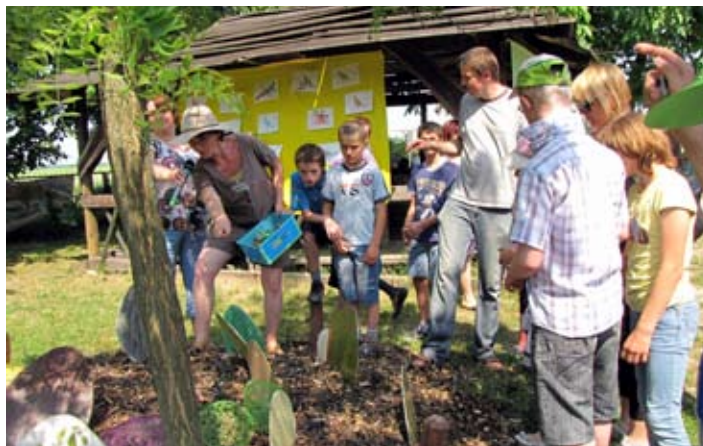
Co jadły i jak się rozmnażały dinozaury? Nauczyciele obrazowo odpowiadali na każde pytanie.