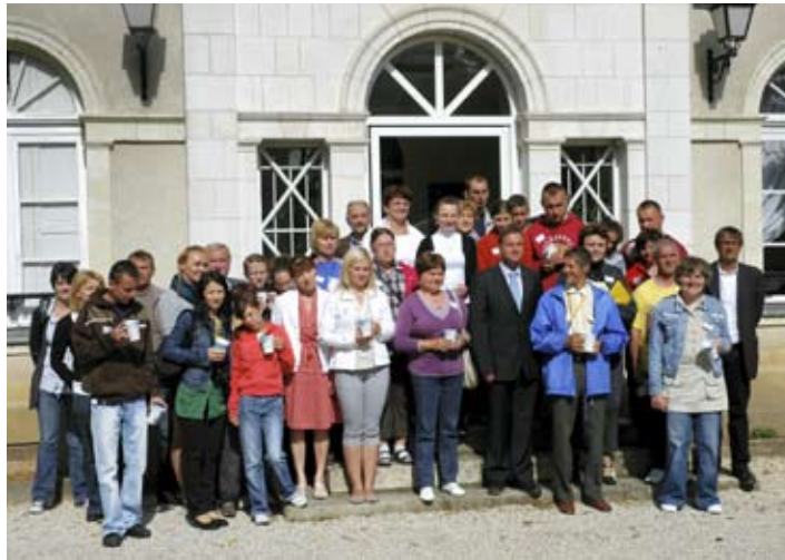
Z pięknymi wspomnieniami i ciekawymi doświadczeniami wrócili do Polski uczestnicy wyprawy do La Chapell.

Przyjeżdżamy do La Chapell w czasie tygodnia osób niepełnosprawnych. Poznajemy ludzi, z którymi będziemy się później często spotykać. Mamy możliwość uczestniczyć w dniu aktywności sportowej osób niepełnosprawnych. Oglądamy mecz piłki nożnej niewidomych. Bardzo podobało nam się wyposażenie boiska, zapewniające bezpieczeństwo grającym, rozwiązanie z naprowadzającymi poszczególnych graczy, no i oczywiście piłka, która jak grzechotka daje graczom znać o swoim położeniu. Próbujemy swoich sił w różnych konkurencjach. Mocujemy się na ręce, walczymy z prawdziwym mistrzem okręgu w zapasach, wspinamy się na strome ściany, strzelamy z łuku. Jest żonglerka, zabawy Klanzy oraz emocje związane z jazdą na koniu. Jesteśmy z siebie dumni, bo wszyscy odważyli się na bliższy kontakt z siodłem. Na zakończenie, podczas uroczystej kolacji, poznajemy władze miasta z merem na czele, przedstawicieli stowarzyszenia do spraw osób niepełnosprawnych oraz organizatorów dnia aktywności sportowej. Zostaje nam tylko