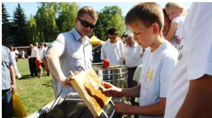
Każdy mógł spróbować też świeżego miodu z plasterów.