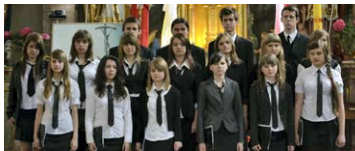
Pieśni i wiersze podkreślały doniosły charakter święta Konstytucji 3 maja.

Pierwszym elementem widowiska była pantomima, która w symboliczny sposób pokazywała walkę dobra ze złem oraz symbolikę polskiej flagi narodowej. Krótka inscenizacja najbardziej przemawiała do dzieci.