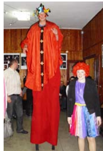
Pamiątkowe zdjęcie z długonogim szcudlarzem było jedną z atrakcji imprezy.

Na zakończenie popisów publiczność nie szczędziła gromkich braw rowerowej grupie Res-Trial z Rzeszowa. Rowerzyści przekaskiwali coraz to wyższe przeszkody, wskakiwali na ponadmetrowe podesty. Oglądając ich pokaz miało