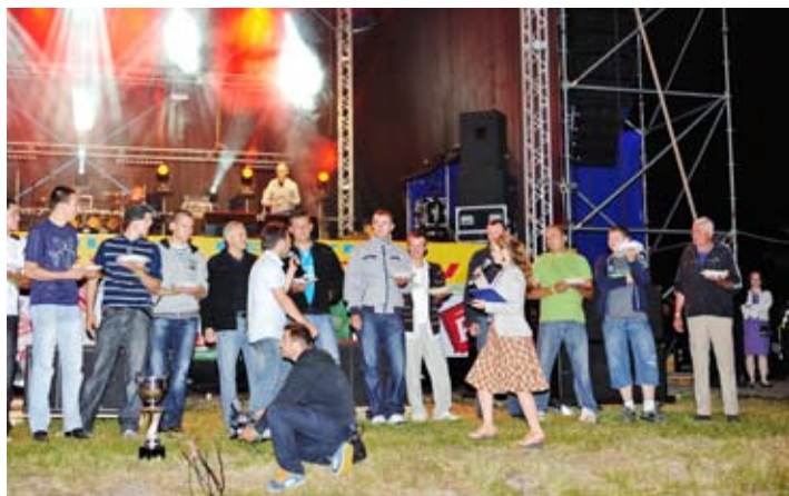
Puchar czeka na mistrza w zjedaniu pierogów na czas.