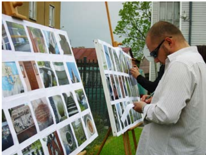
Co to jest? Dużą znajomością miasta wykazali się laureaci konkursu „Kadry Bełżyc”.

Tegoroczne obchody V Dnia Jagiellońskiego odbyły się 15 maja. Widzowie podziwiali układy choreograficzne dziewcząt z zespołu Twister i Nejra oraz pokazy ta-