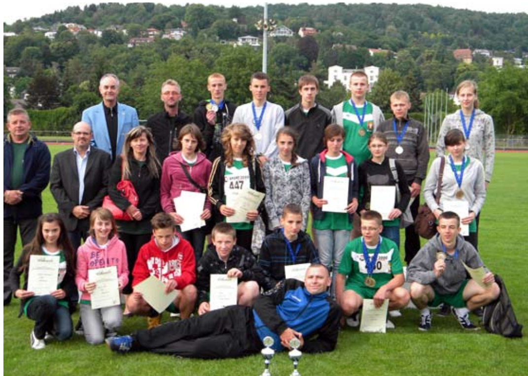
Dumni i szczęśliwi „srebrni lekkoatleci” z powiatu lubelskiego.

We wtorek, korzystając z wszelkich udogodnień spor-