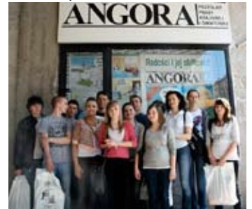
Dziennikarz to nietłwy zawód – przekonali się uczniowie z Pszczelnej Woli.

Wizyta była też okazją do przedstawienia profesjonalistom swoich prac, które brały udział w konkursie „Potęga