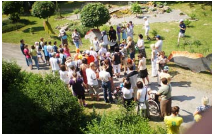
Dzięki wyjątkowym dekoracjom uczniowie przenieśli się w czasy prehistoryczne.

Od początku pikniki w SOSW w Załuczu były ukierunkowane na rozwijanie umiejętności niezbędnych w życiu codziennym, przy-