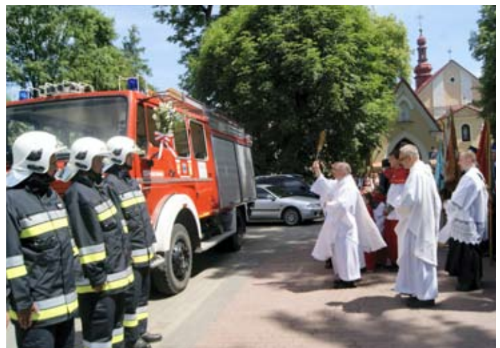
Oby nowy nabytek był potrzebny jak najrzadziej.