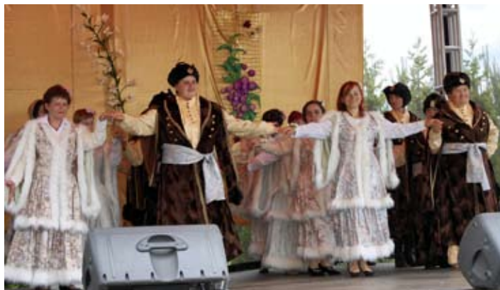
Złote gody uświetnił polonez w wykonaniu mieszanek DPS.

Dom Pomocy Społecznej dla Dzieci w Kielczewicach