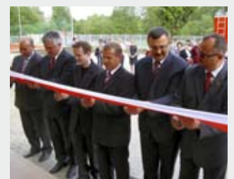
Szkoła na miarę XXI wieku otwarta.