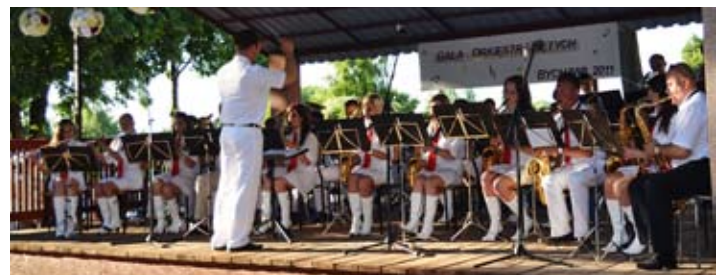
„Henryczki” najbardziej zachwyciły publiczność.

Gorąco oklaskiwano również występy Zespołu Pieśni i Tań-