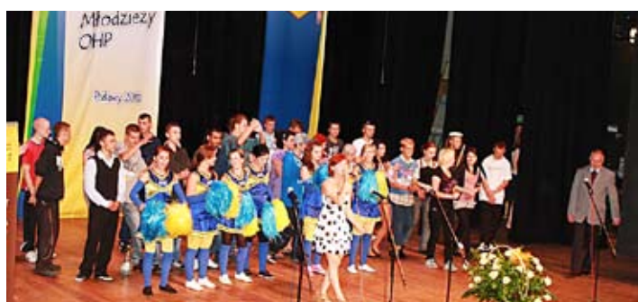
Młodzi artyści spotykają się w Puławach ponownie za rok.