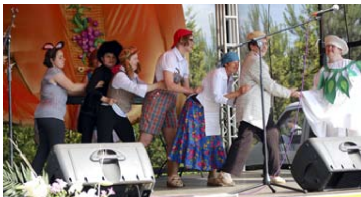
„Wnuczek za babcię, babcia za dziadka, dziadek za rzepkę...” – wiersz Tuwima w obrazowej interpretacji.