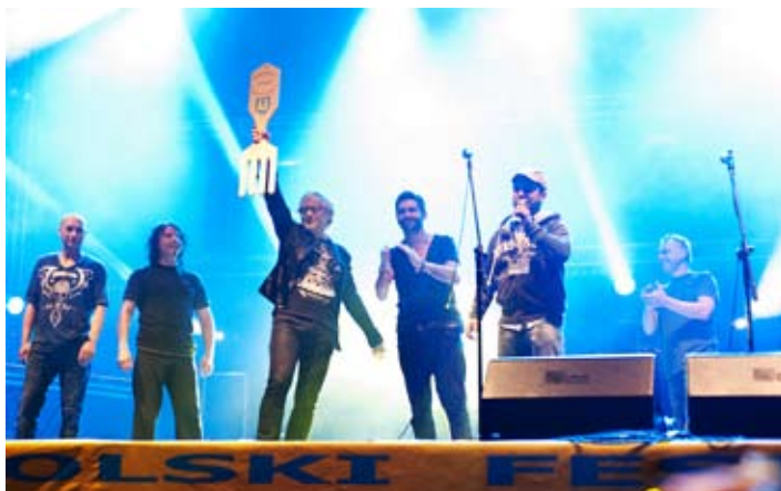
IRA „W krainie pierogów” – rockowa gwiazda wieczoru.